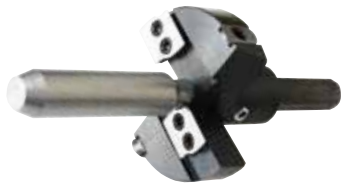
ドリルなし (ガイド × カッター)