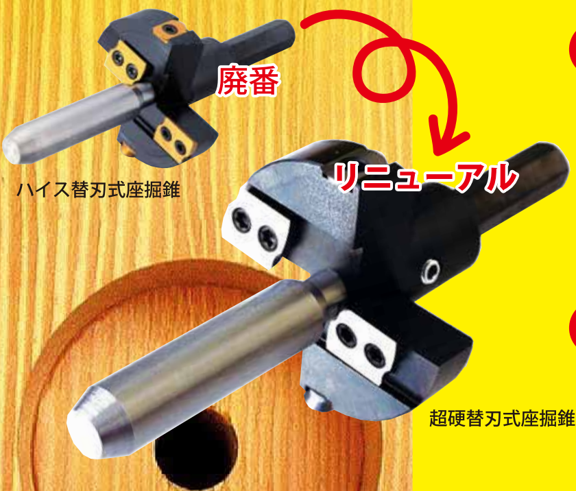
ハイス替刃式座掘錐