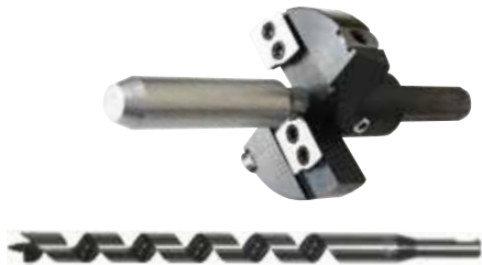
ドリル付 (ガイド × カッター + ドリル 232L)