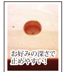
お好みの深さで 止めやすい!