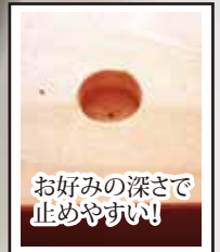
お好みの深さで止めやすい!